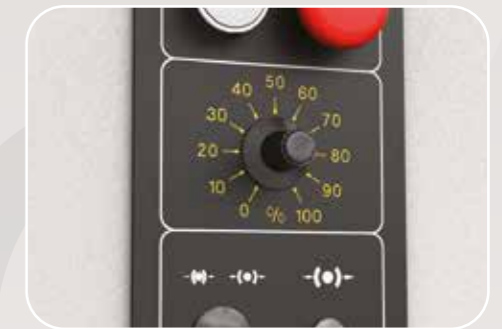
Inverter 3,5 ÷8 m/s Inverseur 3,5 ÷8 m/s Inverter 3,5 ÷8 m/s Wechselrichter 3,5 ÷8 m/s Inversor 3,5 ÷8 m/s