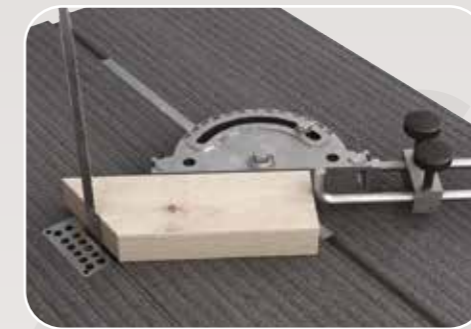
Piano scanalato con squadro per tagli angolari Table rainurée avec guide pour coupes angulaires Grooved table with mitre fence Tisch mit Nute und Anschlag für Winkelschnitte Mesa con ranura y guía para cortes angulares