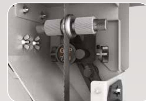
Guidalame inferiore di alta precisione Guidalame inférieur de haut précision High-precision bottom blade guide Hochpräzisions obere Blattführung Guía-sierra inferior de alta precisión