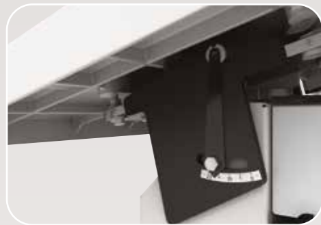
Sistema di inclinazione ergonomica del piano Dispositif de inclinaison ergonomique de la table Ergonomic tilting table device Ergonomische Kipptisch Gerät Sistema de inclinación ergonómica de la mesa