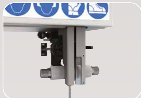
Guidalame superiore di alta precisione Guidalame supérieur de haut précision High-precision top blade guide Hochpräzisions obere Blattführung Guía-sierra superior de alta precisión

ACCESSORI - ACCESSOIRES - ACCESSORIES - ZUBEHÖR - ACCESORIOS