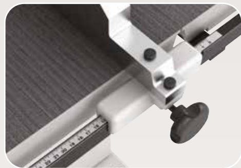
Squadro con riga millimetrata Guide avec échelle graduée Fence with graduated scale Anschlag mit Millimeterlinie Guía con escala graduada